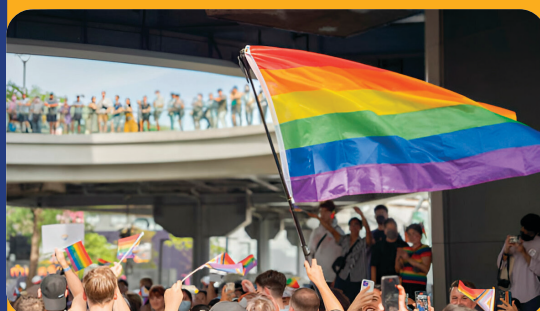
Líder de grupo LGBT do município fala sobre desafios enfrentados pela comunidade LGBTQIA+