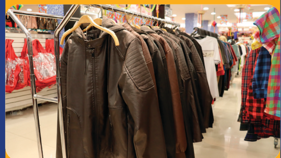
A Evolução da Moda Masculina de Inverno: Tendências e Dicas para a Temporada 2024