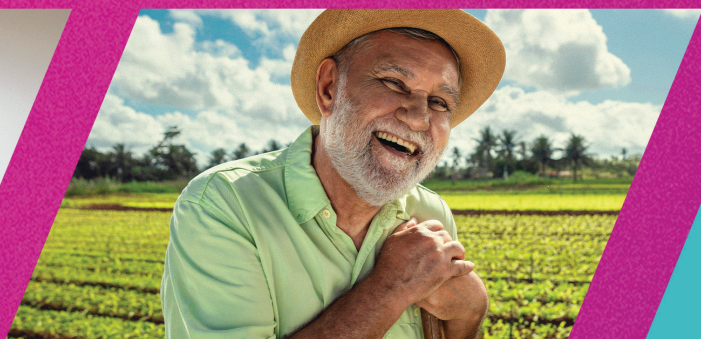
MAIS APOIO PARA A AGRICULTURA FAMILIAR