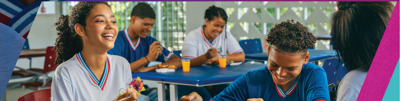
NOVAS ESCOLAS PARA MELHORAR O APRENDIZADO

As novas Escolas de Tempo Integral da Região Metropolitana garantem um ambiente de aprendizagem muito melhor aos nossos estudantes. O investimento recorde na agricultura familiar melhora a vida de quem vive no campo. E o Espaço Maker em Camaçari, o maior do Norte e Nordeste, permite mais acesso à tecnologia e inovação para nossas juventudes. É o Governo do Estado presente em nossa região, trabalhando para transformar a vida da gente.