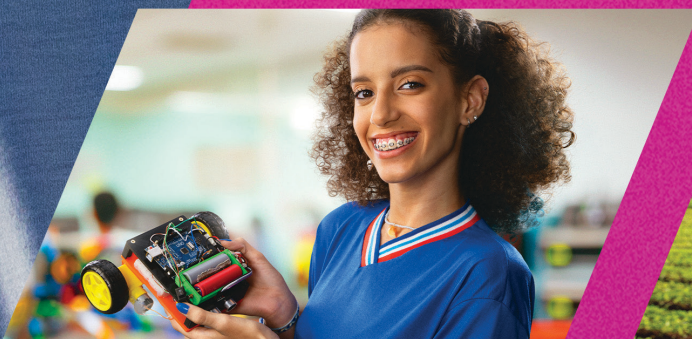
INCENTIVO PARA AS JUVENTUDES