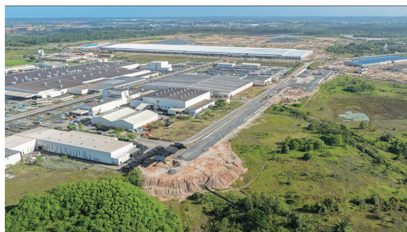
Foto: vista aérea do complexo industrial da BYD em Camaçari

A expansão da geração de emprego e renda ocorre no momento em que a BYD prepara o terreno para fases mais complexas da produção, que incluem as linhas de soldagem, estamparia e pintura, previstas para entrar em operação ainda neste ano, fortalecendo a produção nacional dos veículos eletrificados.