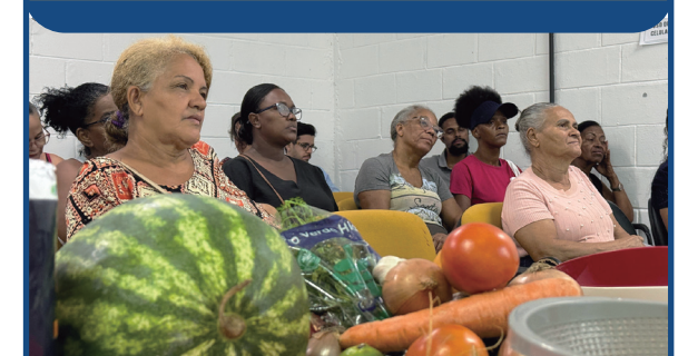
Foto: população de Camaçari participa de oficina socioambiental realizada pela BYD - Divulgação BYD

A BYD retomou, em meados de abril, suas oficinas socioambientais voltadas à comunidade no entorno da fábrica de Camaçari. O foco da nova etapa foi o aproveitamento integral de alimentos, com o ensino de técnicas para reduzir o desperdício e otimizar o orçamento doméstico. A iniciativa, que conta com apoio do poder público municipal, faz parte da estratégia da montadora de integrar o desenvolvimento industrial ao bem-estar social. No ano passado, o projeto já capacitou moradores em temas como produção de sabão artesanal e hortas suspensas, entre outros. As atividades são conduzidas por uma equipe multidisciplinar, garantindo que a sustentabilidade saia da teoria e vire ferramenta prática para as famílias locais.