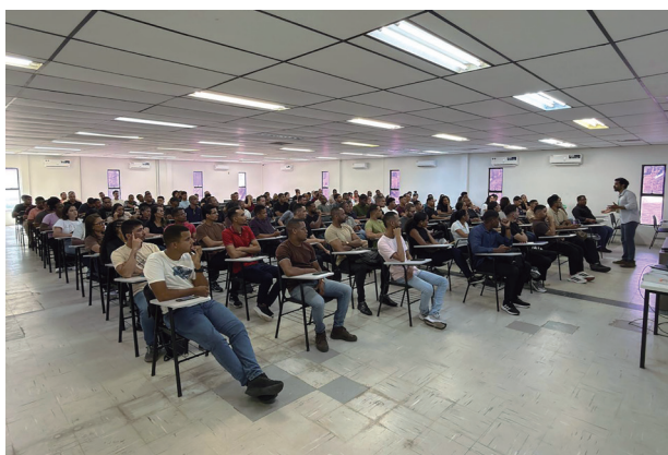
Foto: Reunião de integração dos novos funcionários no Complexo da BYD em Camaçari/BA - Divulgação BYD

A BYD deu mais um passo decisivo na consolidação de seu complexo industrial em Camaçari. Nos últimos dias, a gigante da mobilidade elétrica integrou mais de 400 novos profissionais, fazendo com que a fábrica supere a marca de 4 mil empregos diretos. O avanço faz parte de um plano de expansão acelerado que pretende transformar a região no maior polo de veículos eletrificados da América Latina.