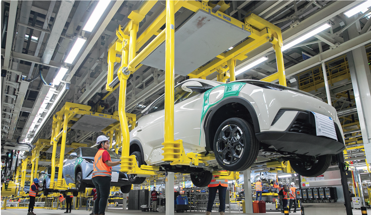
Foto: Colaboradora da BYD Auto do Brasil durante expediente em Camaçari/BA

A BYD deu mais um passo decisivo na consolidação de seu complexo industrial em Camaçari. Nos últimos dias, a gigante da mobilidade elétrica integrou mais de 400 novos profissionais, fazendo com que a fábrica supere a marca de 4 mil empregos diretos. O avanço faz parte de um plano de expansão acelerado que pretende transformar a região no maior polo de veículos eletrificados da América Latina.